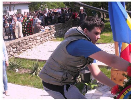
Școlile Generale 1 și 3 VIDELE