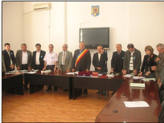
Consiliul Local reunit