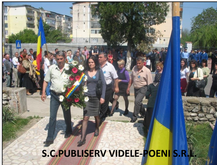
S.C.PUBLISERV VIDELE-POENI S.R.L.