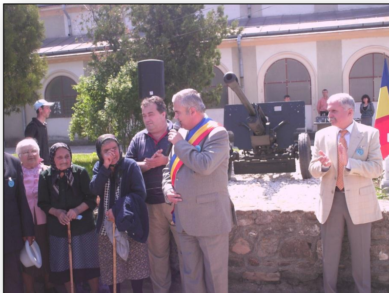
Discursul Primarului oraşului Videle