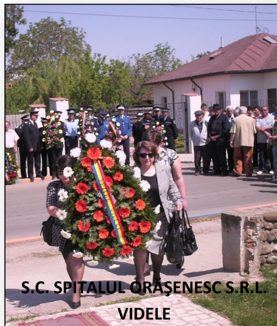
S.C. SPITALUL ORĂȘENESC S.R.L. VIDELE