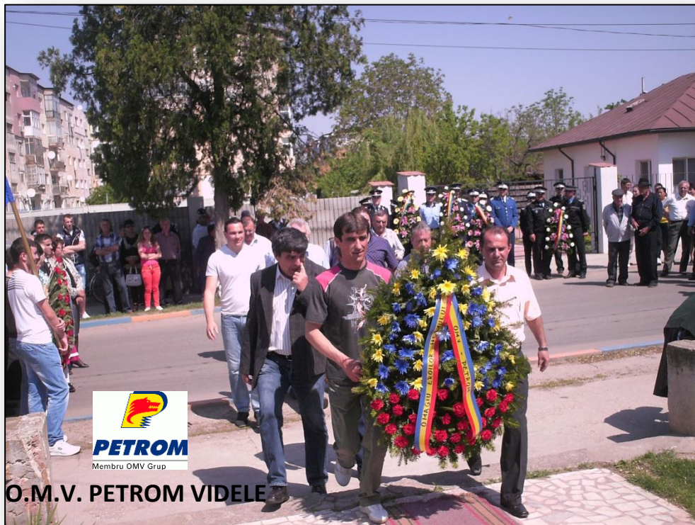
O.M.V. PETROM VIDELE